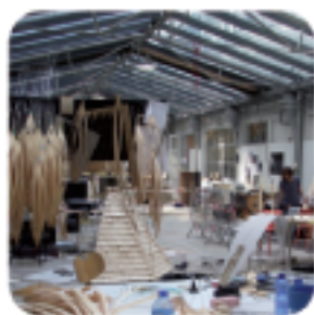
L'ENSCI Les Ateliers

Trois écoles de design françaises s'associent pour un workshop d'une semaine à Paris . Un séminaire de réflexion pour échanger autour du design aujourd'hui en France , de ses valeurs et de la vision qu'en a notre société. Plusieurs champs d'action du design sont représentés au sein du groupe : le transport, l'alimentaire, le produit et l'espace.