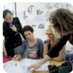
L'École de design Nantes Atlantique